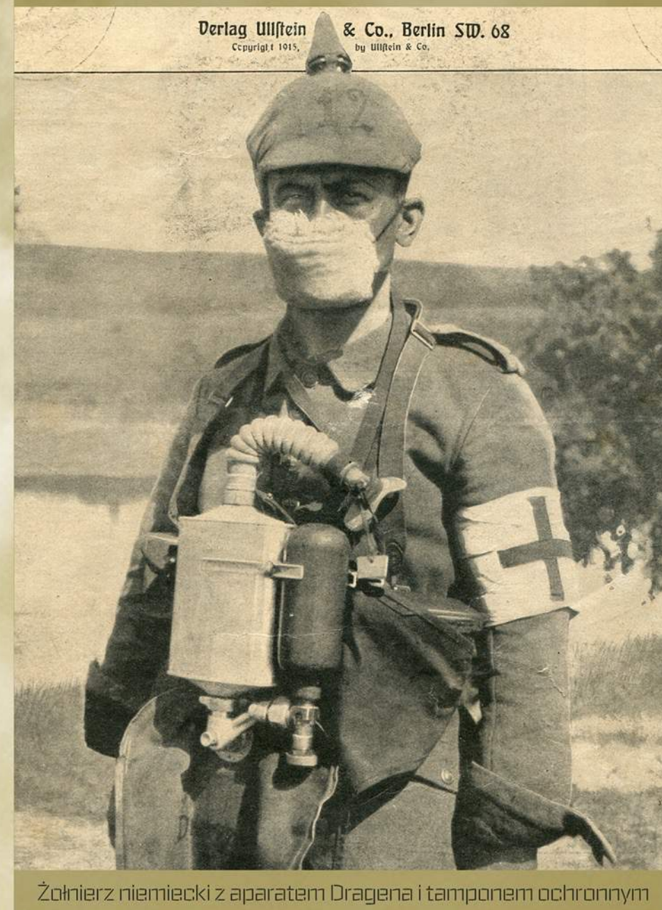
Żołnierz niemiecki z aparatem Dragena i tamponem ochronnym

W szeregach obu walczących pod Bolimowem armii służyli Polacy rekrutowani do armii zaborczych. Szacuje się, że na wszystkich frontach I wojny światowej, w obcych armiach, często przeciwko sobie, walczyło ponad 3 miliony naszych rodaków.